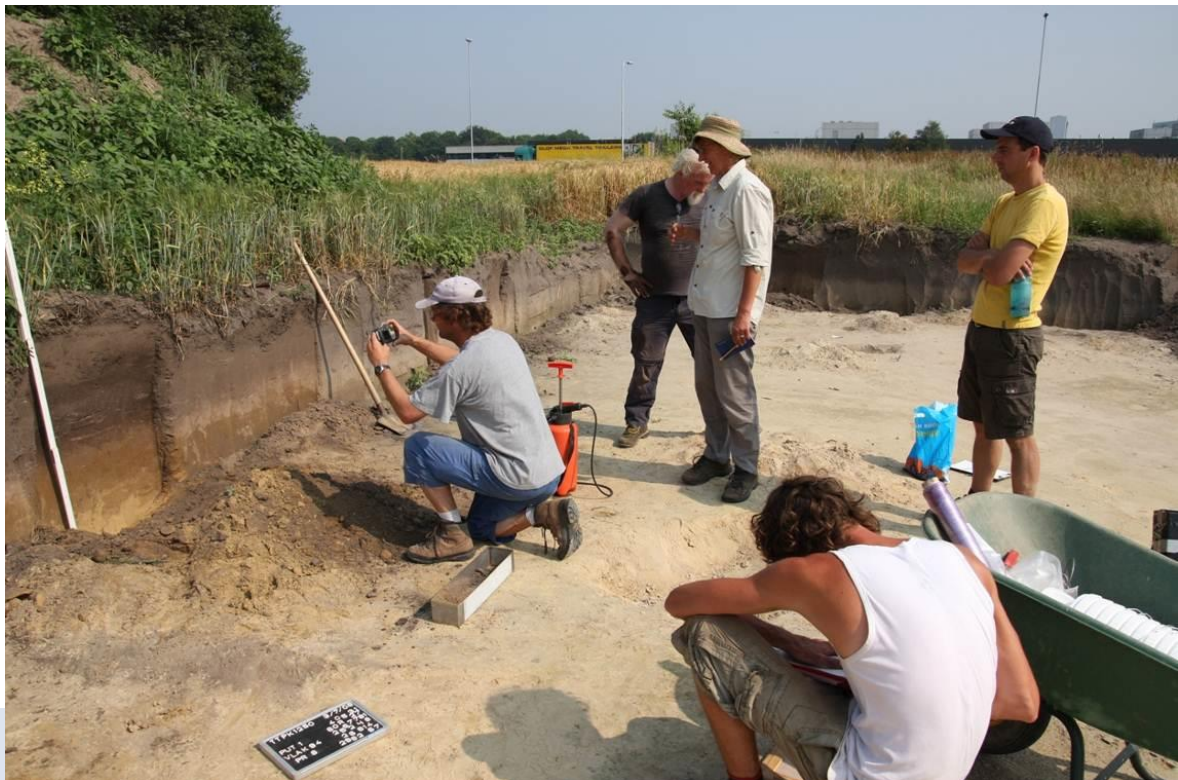
Foto: Overleg tussen een archeoloog, fysisch geograaf en botanici over een geschikte monsterlocatie voor palynologisch onderzoek.