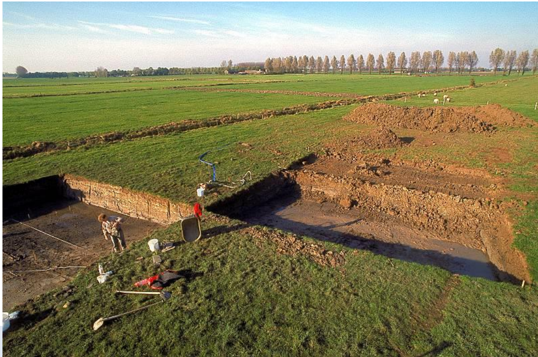
Foto: Uitvoering van een proefsleuvenonderzoek. Afhankelijk van de archeologische verwachting kunnen verschillende methoden worden ingezet. Het is daarbij mogelijk om een IVO-P te combineren met een IVO-O.