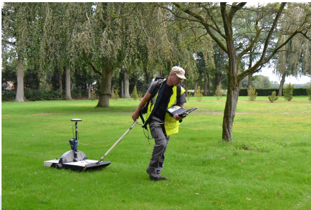
Foto: Binnen inventariserend veldonderzoek valt geofysisch onderzoek onder IVO-Overig. Voor het geofysisch onderzoek mag gekozen worden, als ingeschat wordt dat een geofysisch onderzoek toegevoegde waarde heeft voor de beantwoording van de archeologische vraagstelling, bijvoorbeeld als verwacht mag worden dat archeologisch materiaal of structuren in de bodem een meetbaar contrast veroorzaakt. Geofysisch onderzoek kan ook – volgend op een bureauonderzoek – vooraf gaan aan het opstellen van een PvE. In dat geval valt het niet onder IVO-Overig (zie protocol PvE).

Het IVO kan uitgevoerd worden als een IVO-proefsleuven (IVO-P) (waarbij veldwerk o.a. bestaat uit het aanleggen van proefsleuven en proefputten) of als een IVO-overig (IVO-O) (waarbij het veldwerk kan bestaan uit kartering, boringen, profielputjes of geofysisch onderzoek). IVO-P en IVO-O zijn in dit protocol als afzonderlijke onderdelen uitgewerkt (zie paragraaf 1.2).