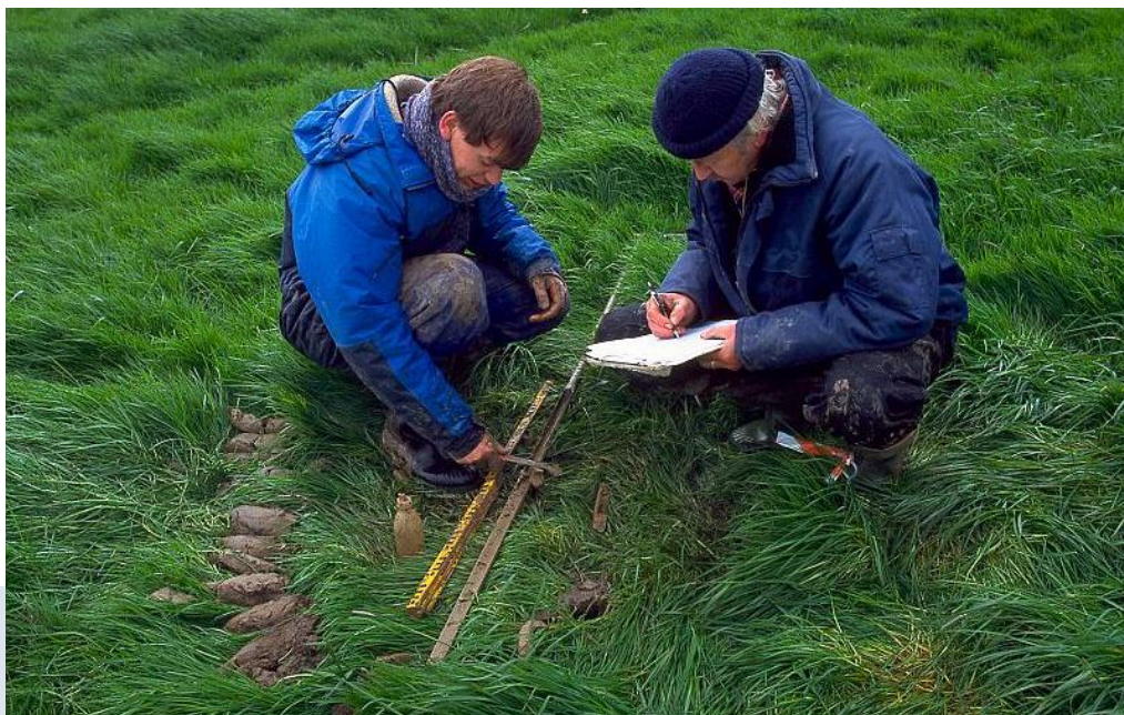
Foto: Karterend booronderzoek met behulp van een guts.

Let wel: voor goed uitgevoerd archeologisch onderzoek is het niet altijd nodig om al deze fasen te doorlopen.